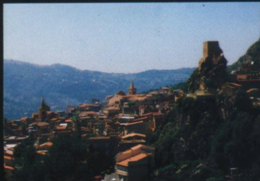
Castel Turio e panoramica del paese