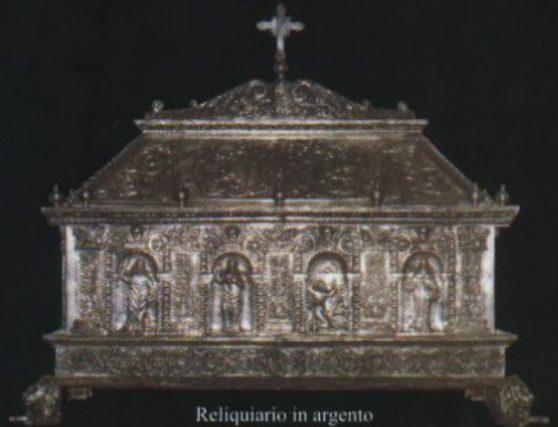
Reliquiario in argento