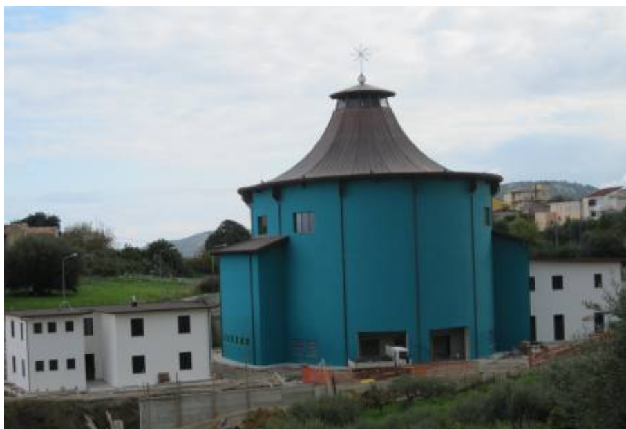
Concattedrale Santi Martiri del XX secolo (vista esterna e particolare aula liturgica - 6 dicembre 2011)