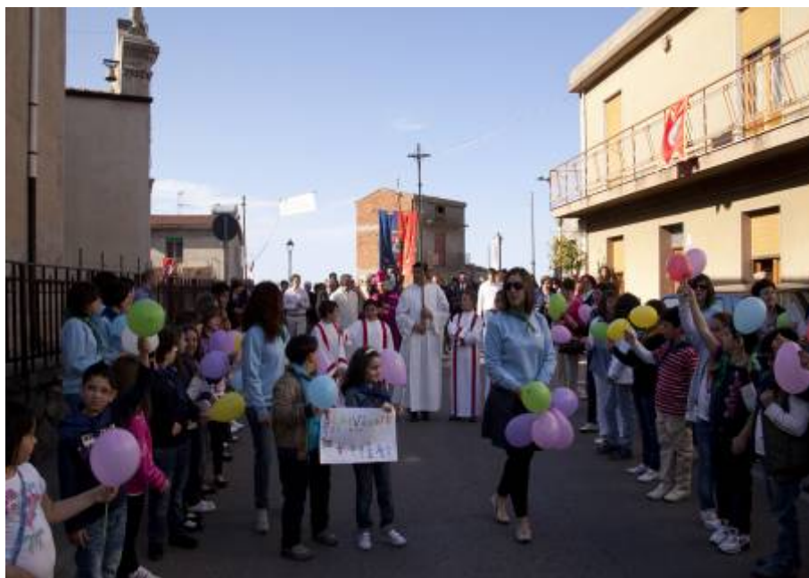
Frazzanò: Visita Pastorale 5 - 8 maggio 2012